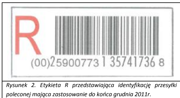
Rysunek 2. Etykieta R przedstawiająca identyfikację przesyłki poleconej mająca zastosowanie do końca grudnia 2011r.

Celem usprawnienia procesów nadawania i doręczania przesyłek poleconych na terenie całego kraju, z początkiem 2012r. wprowadzono nowe zasady odnoszące się do oznaczania przesyłek poleconych w oparciu o nową etykietę R – Rysunek 3. Etykieta R przedstawiająca identyfikację przesyłki poleconej mająca zastosowanie od początku stycznia 2012r. Nowa etykieta R posiada 3 nalepki cząstkowe z kodem kreskowym w symbolice GS1-128, na której znajduje