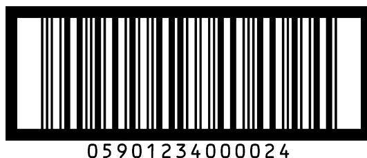
Rysunek 4 Oznaczenie kodowe na opakowaniu hurtowym / niedetalicznym: numer GTIN-13 przedstawiony w kodzie ITF-14

Przykłady oznaczeń kodem ITF-14 przedstawiają Rysunek 4 i 5.