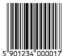
Rysunek 1 Oznaczenie kodowe na wyrobie detalicznym: numer GTIN-13 w kodzie EAN-13

Wyroby w opakowaniach zbiorczych o stałej ilości, w tym towary w opakowaniach o różnorodnej ale stałej zawartości / standardowe miksy – jednostki handlowe detaliczne sztukowe, mogą być identyfikowane i kodowane w jeden z następujących sposobów: