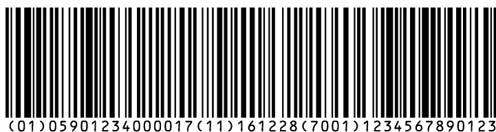
Rysunek 3 Oznaczenie kodowe na wyrobie niedetalicznym w kodzie GS1-128 z numerem NSN

W praktyce wyrób w opakowaniu handlowym niedetalicznym i nielogistycznym sztukowym może być już oznaczony przez producenta kodem kreskowym GS1, przedstawiającym tylko numer GTIN tej jednostki handlowej, w jeden z następujących sposobów: