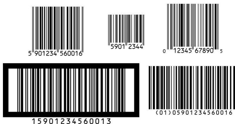
Rysunek 7 Przykłady kodów kreskowych, przedstawiające numery

Poniżej przedstawione zostały przykłady symboli kodów GS1, które przedstawiają numery GTIN, które należy wykorzystać – Rysunek 7.